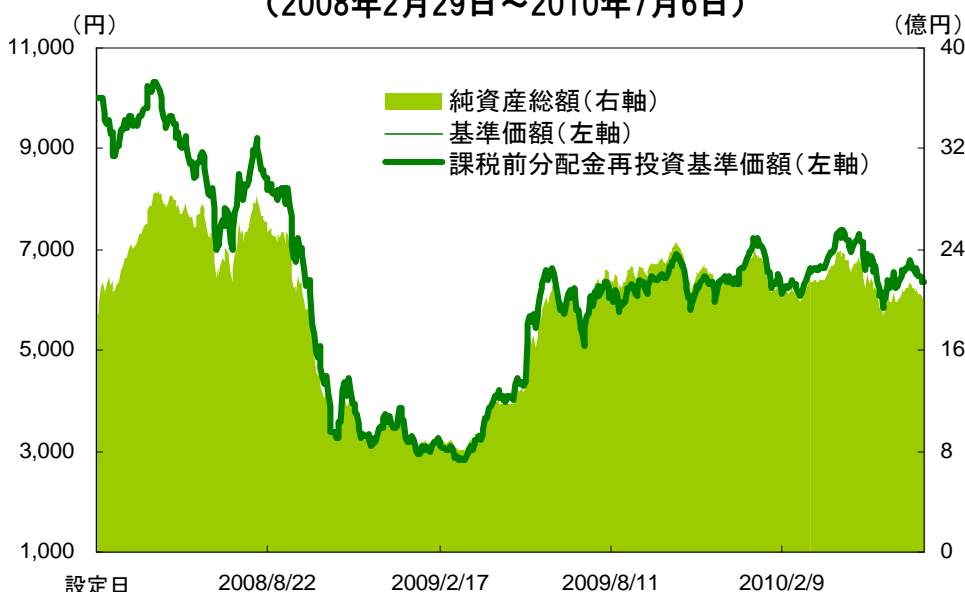
【基準価額と純資産総額の推移】 (2008年2月29日～2010年7月6日)

* 基準価額は、信託報酬控除後、信託財産留保額控除前、課税前です。 * 上記グラフは過去の実績であり、将来の運用成果をお約束するものではありません。 * 課税前分配金再投資基準価額とは、基準価額に各収益分配金(課税前)を、その分配が行われる日に全額再投資したと仮定して算出したものであり、当社が公表している基準価額とは異なります。