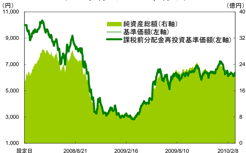
【基準価額と純資産総額の推移】 (2008年2月29日～2010年3月4日)

* 基準価額は、信託報酬控除後、信託財産留保額控除前、課税前です。 * 上記グラフは過去の実績であり、将来の運用成果をお約束するものではありません。 * 課税前分配金再投資基準価額とは、基準価額に各収益分配金(課税前)を、その分配が行われる日に全額再投資したと仮定して算出したものであり、当社が公表している基準価額とは異なります。